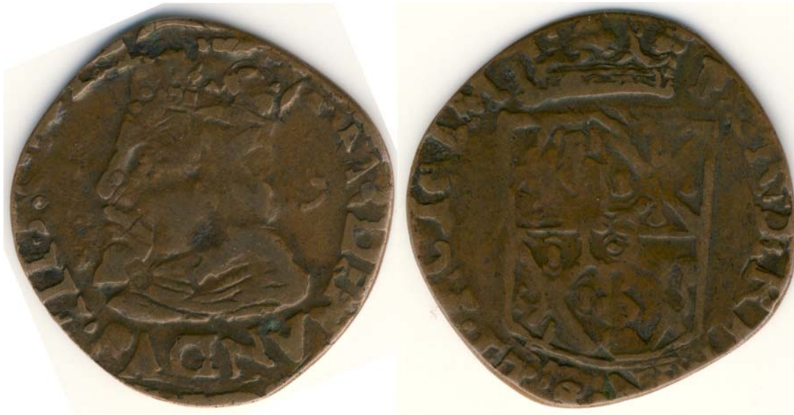
Joost Maximiliaan van Bronckhorst – Batenburg (1617 – 1662), Oord (PW 9115 / GRONS. 4) Z.J., geslagen over een Liard Reckheim „FR“ – (REC.11) D: 23,9 – 25,7mm, G: 2,85g